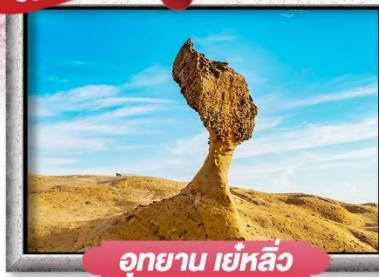
อุทยาน เย่หลิว