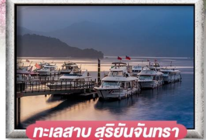
ทะเลสาบ สุริยันจินทรา

พิเศษ!! บุฟเฟ่ต์ชาบูได้ทุกวัน + เสี่ยวหลงเปา