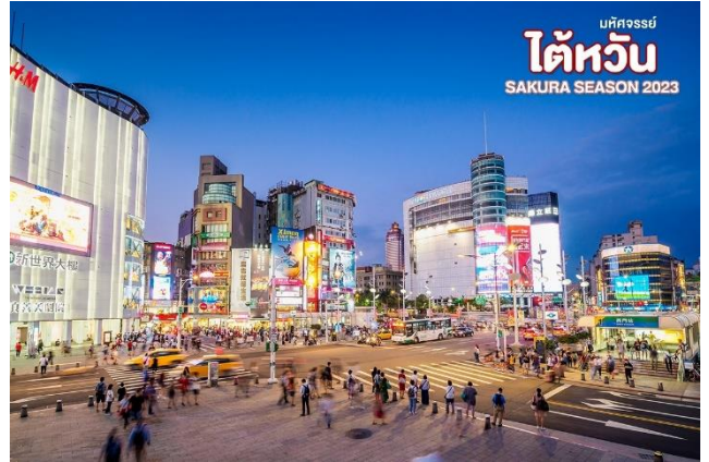
มหัสจรรย์ ไต้หวัน SAKURA SEASON 2023

คำ นำท่านเดินทางสู่ ตลาด ซีเหมินติง (Ximending) หรือที่คนไทยรู้จักกันในนาม สยามสแควร์แห่งไทเปเป็นย่านช้อปปิ้งของวัยรุ่นและวัยทำงานของไต้หวัน ยังเป็นแหล่งช้อปปิ้งของนักท่องเที่ยวด้วยเช่นกัน ในย่านนี้เป็นถนนคนเดินโดยแบ่งโซนเป็นสีต่างๆ เช่น แดง เขียว น้ำเงิน โดยสังเกตจากเสาข้างทางจะมีการระบุหมายเลขและทำสีไว้อย่างเป็นระเบียบ ร้านค้าแนะนำสำหรับนักท่องเที่ยวชาวไทย ซึ่งราคาถูกกว่าไทยประมาณ 30 % ได้แก่ ONITSUKA TIGER, NEW BALANCE, ADIDAS, H&M, MUJI ซึ่งรวมสินค้ารุ่นหายากและราคาถูกมากๆ